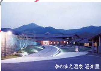
ゆのまえ温泉 湯楽里

☎0966-46-0835 水上村湯山1619 ☎11:30~14:00(L.O.) ☎3月~金曜日(土日祝営業)