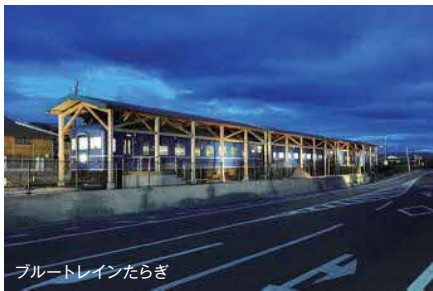
ブルートレインたらぎ